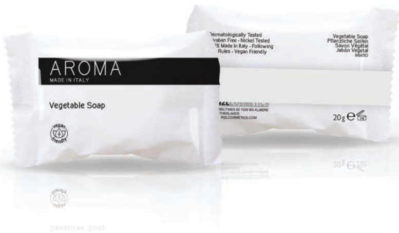
VEGETABLE SOAP (MASSAGE) 20 gr - BC153015