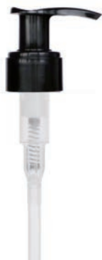
POMP ZWART Pomp Black 53404011