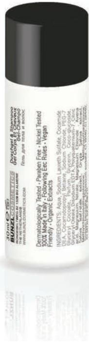
HAIR & BODY WASH 30 ml - BC153002