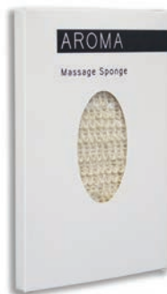
MASSAGE SPONS Massage Sponge BC153028