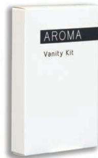
VERZORGINGSSET Vanity Kit BC153023