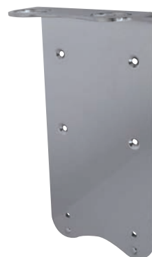
BEUGEL DUBBEL Double bracket 5340403