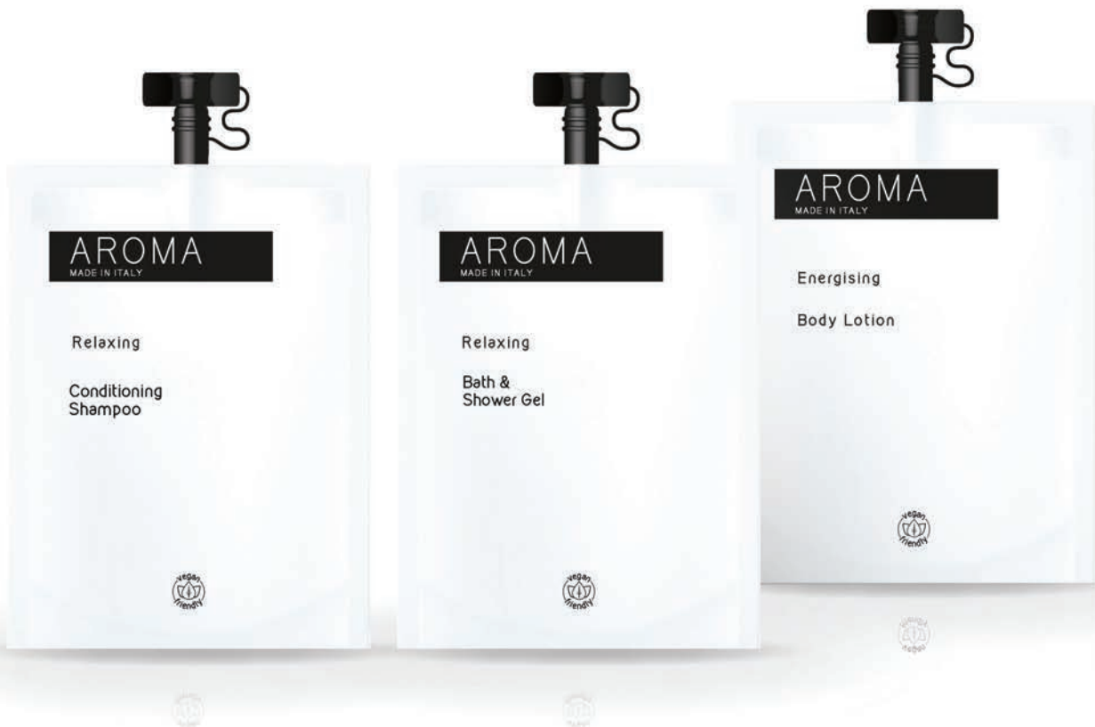
CONDITIONING SHAMPOO 30 ml - BC153008

A doypack is a luxury sachet with a reclosable screw cap. Doypacks can be placed standing up, perhaps with a display in the form of a strip with three or four holes. They produce 70% less CO 2 and waste in comparison to bottles with the same contents.