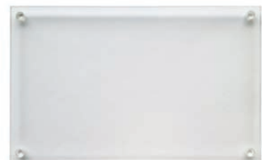
DISPLAY Tray BC154010