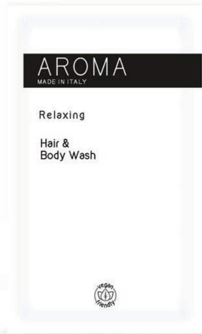
HAIR & BODY WASH 10 ml - BC153012