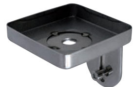
VIERKANTE HOUDER Square holder 5340083