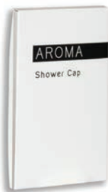
DOUCHEKAPJE Shower Cap BC153027