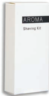
SCHEERSET Shaving Kit BC153026