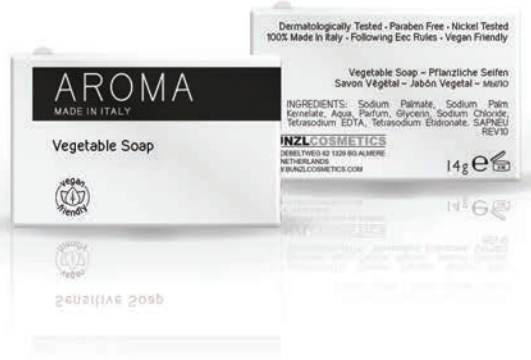
VEGETABLE SOAP 14 gr - BC153014